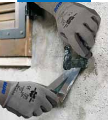
Posa di zanche per finestre con Lampocem