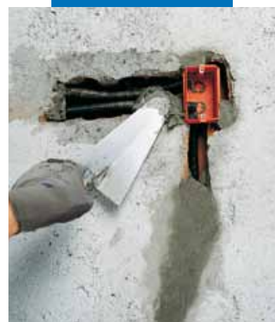
Fissaggio di scatole e tubazioni elettriche con Lampocem