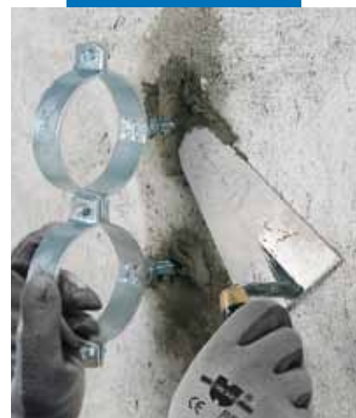
Fissaggio di collari per tubazioni con Lampocem