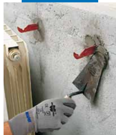
Posa di zanche per caloriferi con Lampocem